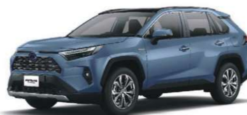
* 石漠藍 8W2