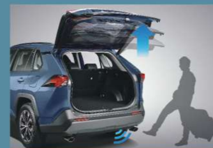
■ 足踢感應式電動尾門 (2.0 旗艦以上)

12.3吋大螢幕，搭配Drive+ Link 智能車載系統4G旗艦版六大核心功能，行車資訊all-in-one，提供即時路況、手機預約導航等功能，影音體驗再升級。