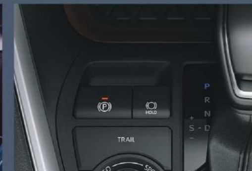
■ EPB 電子駐車煞車系統 (附 Auto Hold 功能)