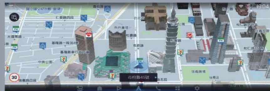
■ 智慧導航 (2.0 ADVENTURE 4WD、2.5 HYBRID 旗艦 4WD)

12.3吋大螢幕，搭配Drive+ Link 智能車載系統4G旗艦版六大核心功能，行車資訊all-in-one，提供即時路況、手機預約導航等功能，影音體驗再升級。