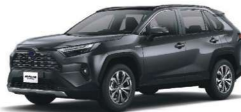
* 雲河灰 1G3