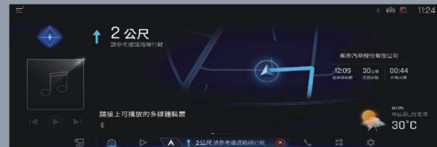
■ 12.3吋高解析度螢幕 (2.0 旗艦以上)