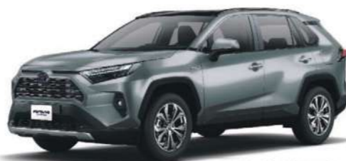
* 月岩綠 6X3