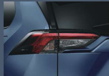
■ LED 光條式尾燈組