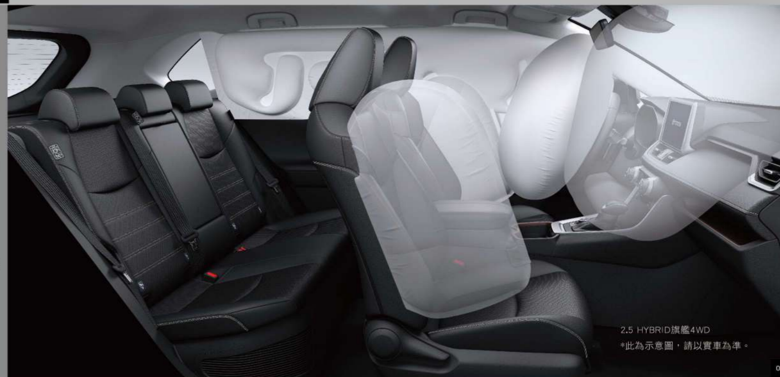
2.5 HYBRID旗艦4WD *此為示意圖，請以實車為準。