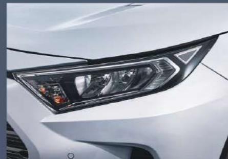
■ LED 反射式頭燈組 (汽油車型)