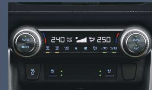
■ S-Flow 智慧型雙區恆溫控制空調系統 (2.0 尊爵以上)