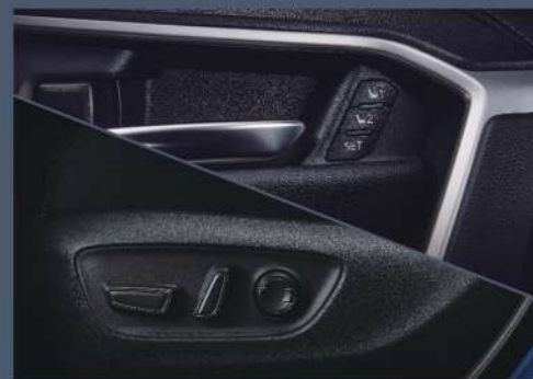
■ 電動座椅附記憶功能 (2.0 尊爵、2.0 旗艦、2.5 HYBRID 旗艦以上)