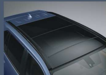
■ 全景式電動天窗 (2.0 ADVENTURE 4WD、2.5 HYBRID 旗艦 4WD)