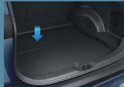
■ 上下可調式行李廂底板