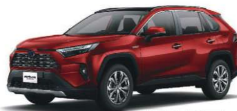
* 躍動紅 373