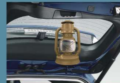
■ 多功能尾門握把/掛勾