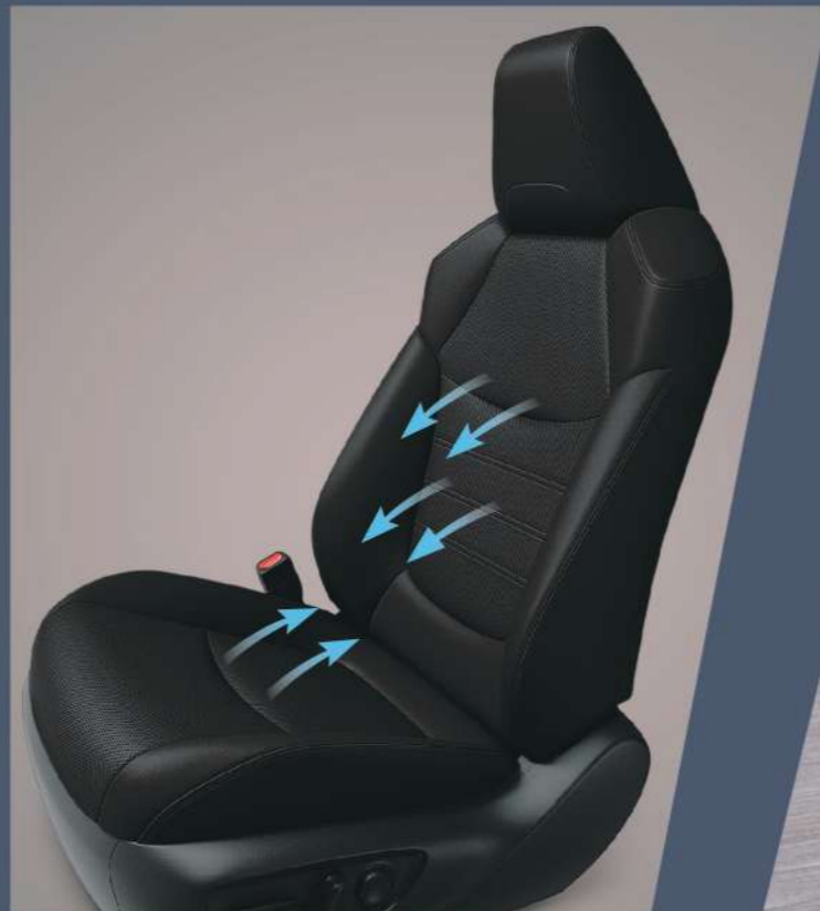
■ 雙前座通風座椅 (2.5 HYBRID 旗艦以上)