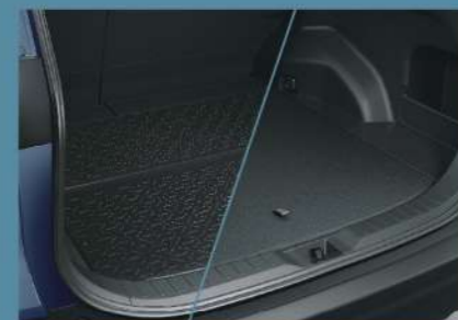
■ 雙面使用行李廂底板