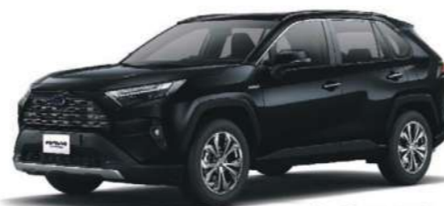
* 尊爵黑 218