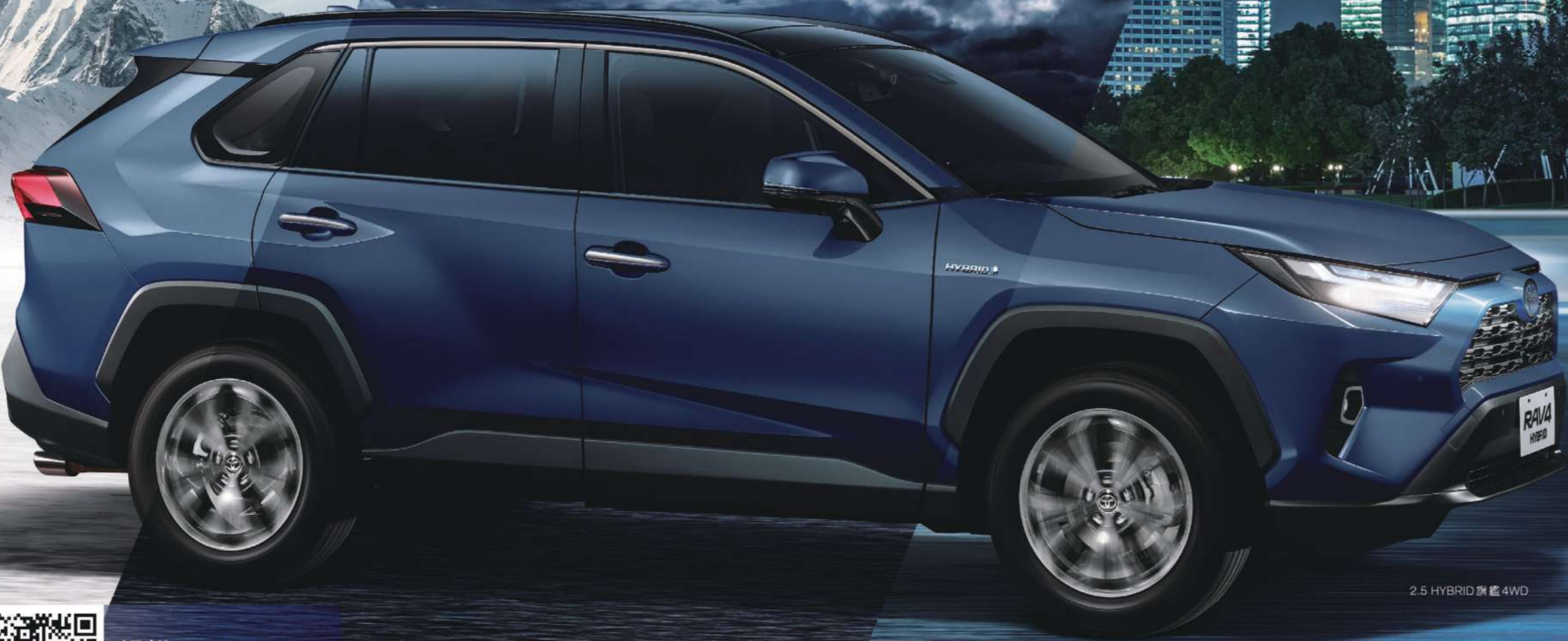
2.5 HYBRID 旗艦 4WD