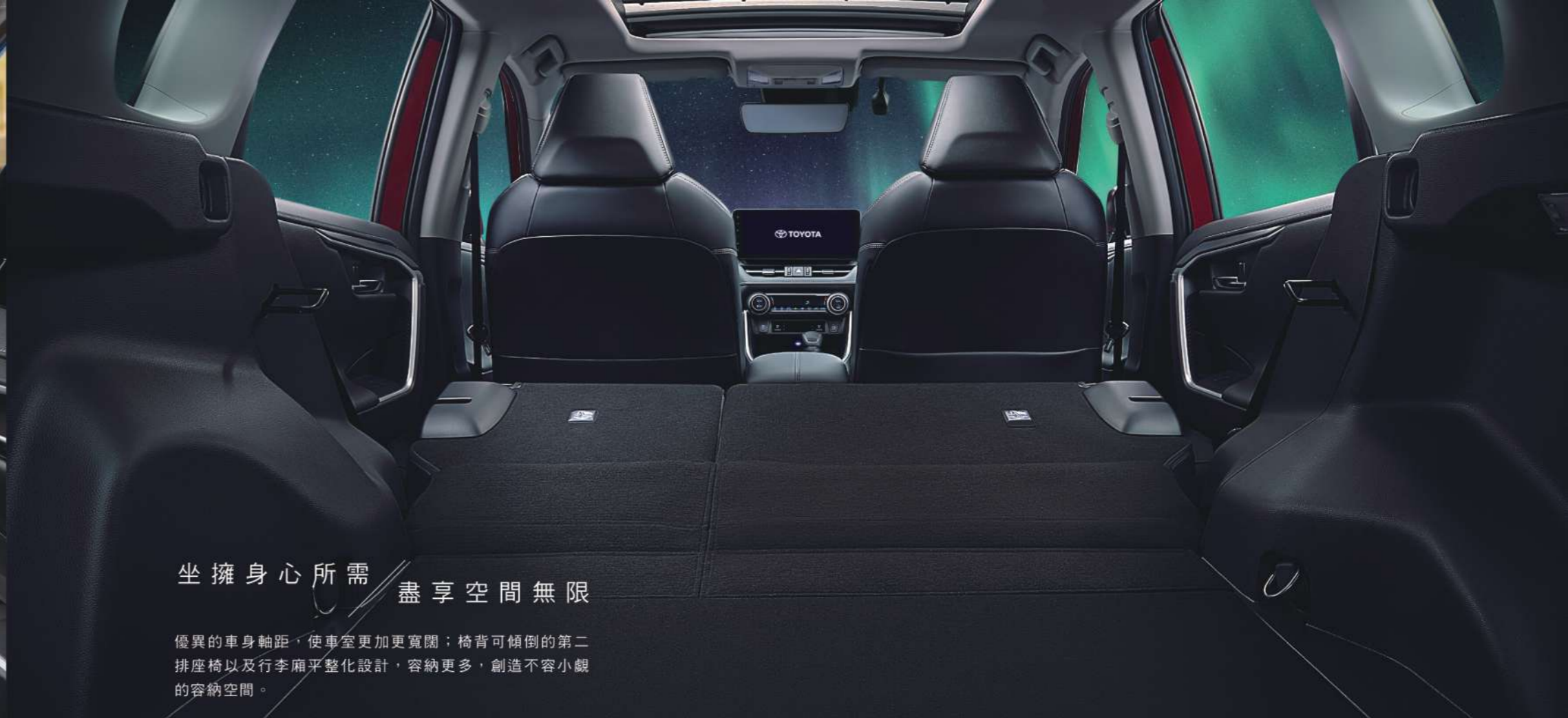
2.5 HYBRID 旗艦 4WD