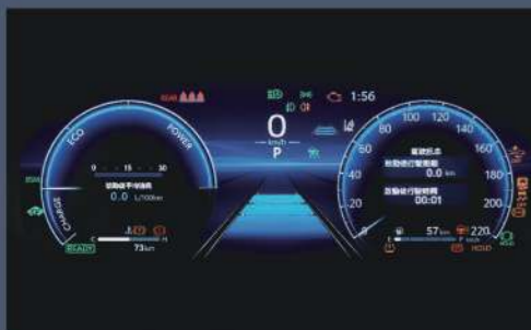
■ 12.3吋全彩數位式儀錶板 附 MID (2.0 尊爵以上、2.5 HYBRID 尊爵除外)