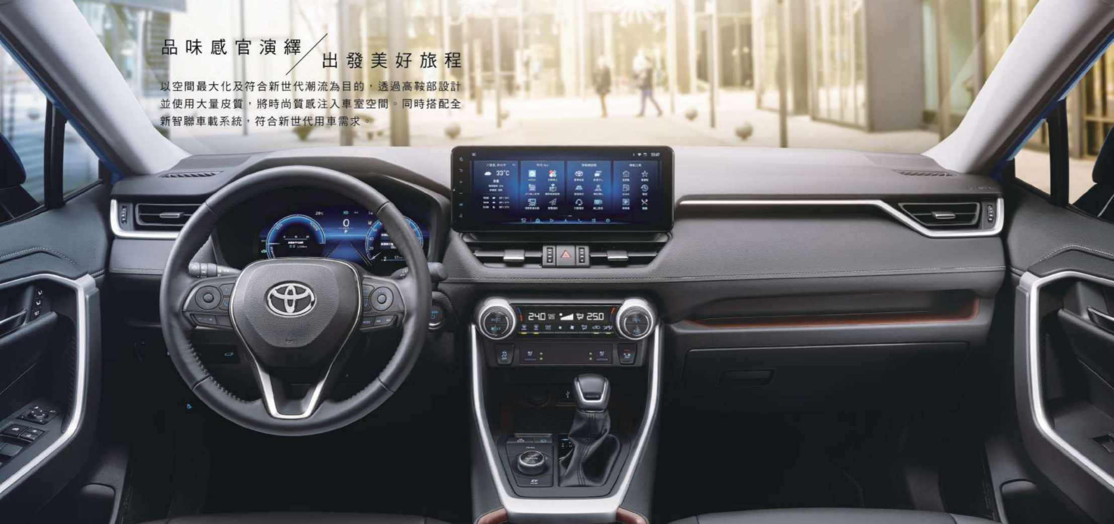
2.5 HYBRID 旗艦 4WD

以空間最大化及符合新世代潮流為目的，透過高鞍部設計並使用大量皮質，將時尚質感注入車室空間。同時搭配全新智聯車載系統，符合新世代用車需求。