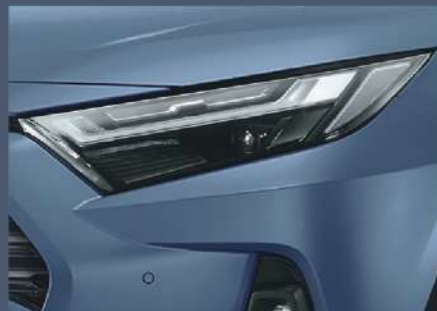
■ LED Bi-Beam 頭燈組 (HYBRID 車型)