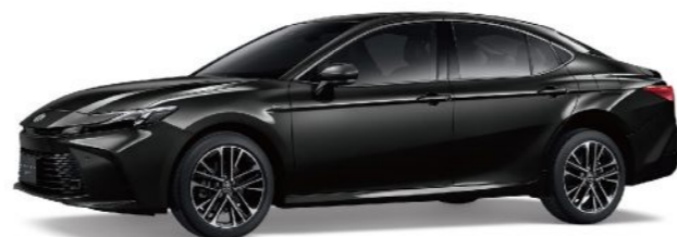
218 / 尊爵黑