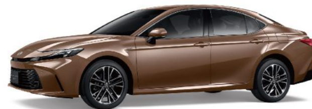
4Y6 / 晶曜銅