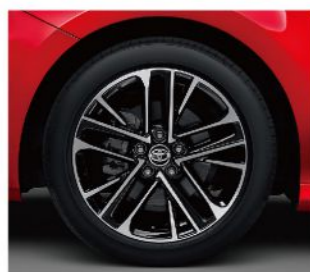
18吋雙色切削鋁圈 (HYBRID旗艦、汽油旗艦)