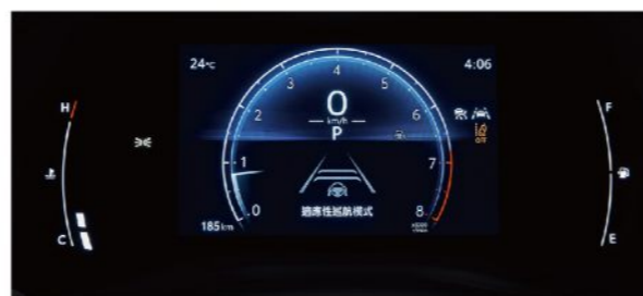
7吋全彩式數位儀錶板 (HYBRID尊爵、汽油豪華)