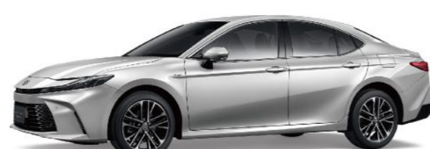
1F7 / 極光銀