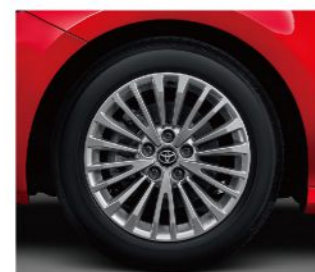
17吋銀色多幅式鋁圈 (HYBRID尊爵、汽油豪華)