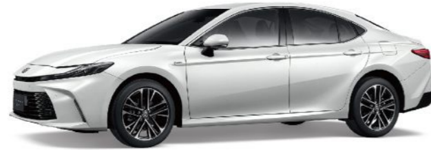
089 / 鉑鑽白