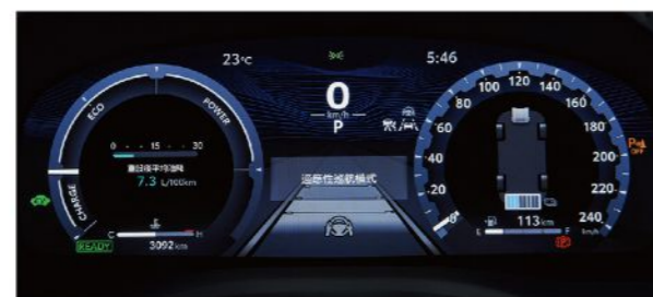
12.3吋全彩式數位儀錶板 (HYBRID旗艦、汽油旗艦)