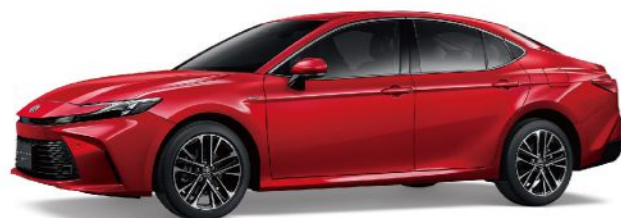
3U9 / 極羨紅